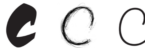
Choc's c, first sketch for Arlette, final c of Arlette Thin.

Its range of 8 weights (6 for Thai) allows its use both in text and display. In both writing systems Arlette (อาร์เล็ทต์) is surprisingly legible in small sizes and beautiful in big ones.